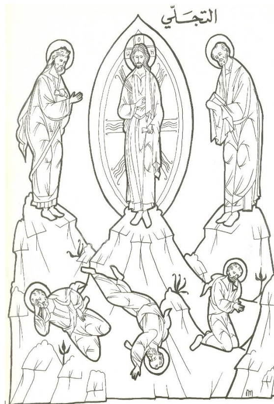
Transfiguración del Señor

لَمَّا تَجَلَّيْتَ أَيُّهَا الْمَسِيحُ الْإِلَهَ فِي الْجَبَلِ. أَظْهَرْتَ مَجْدَكَ لِلتَّلَامِيذِ حَسْبَمَا اسْتَطَاعُوا. فَأَشْرَقَ لَنَا نَحْنُ الْخَطَاةُ نُورَكَ الْأَزَلِي. بِشَفَاعَاتِ وَالِدَةِ الْإِلَهَ، يَا مَانِحِ النُّورِ الْمَجْدُ لَكَ.